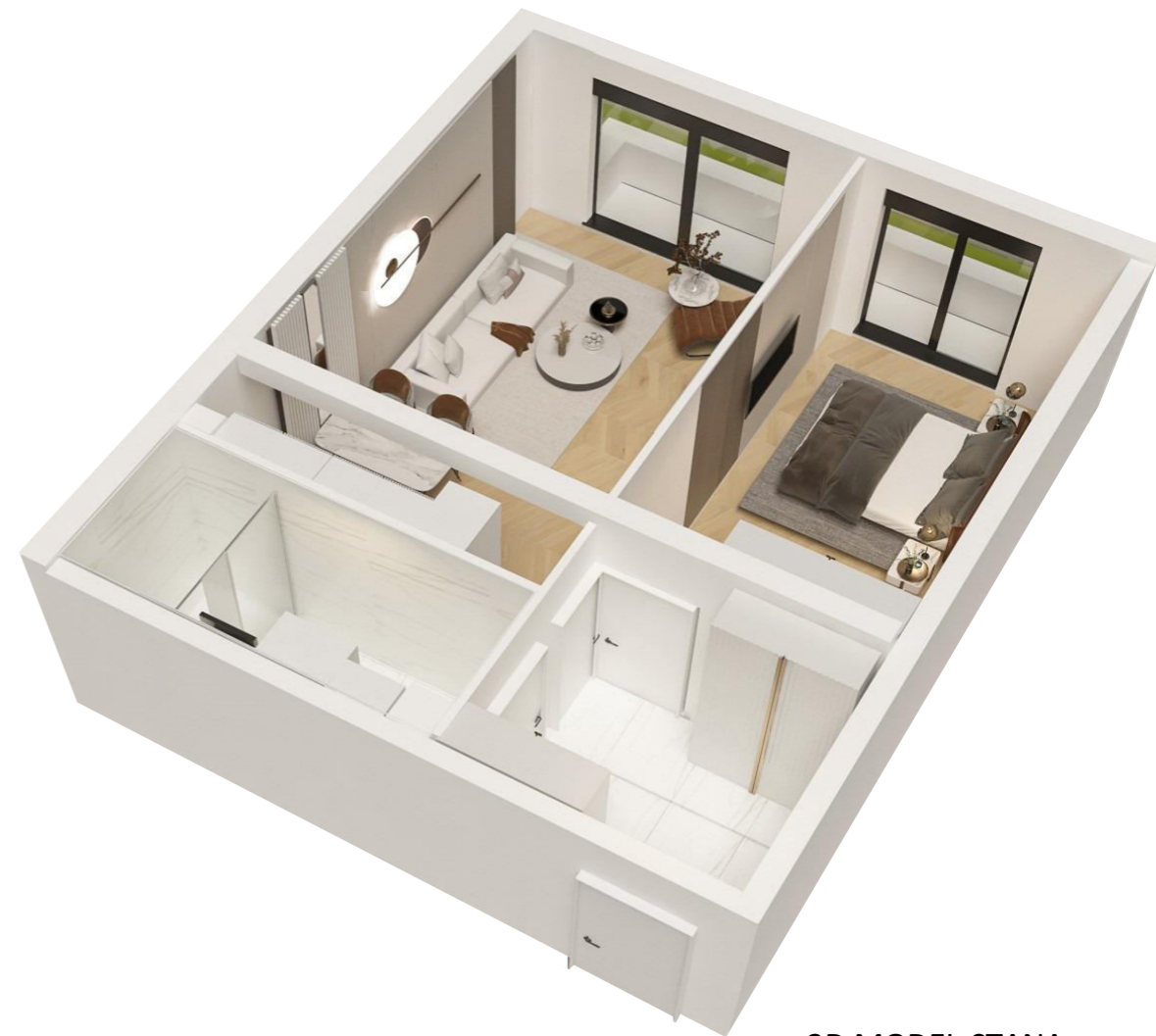
3D MODEL STANA

- Stanovi: 11, 26, 41, 56, 71, 86, 101, 116, 131.